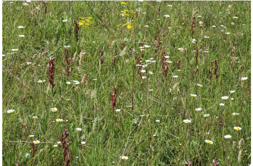
Serapias vomeracea : le Sérapias à long labelle