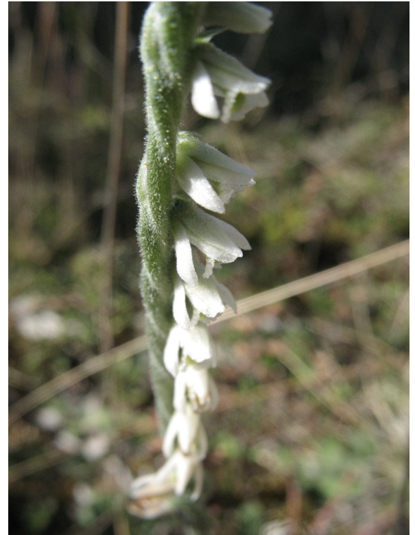
Spiranthes spiralis – Spiranthe d'automne